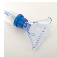
Apparater og udstyr til medico & fødevarer.