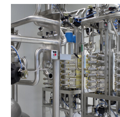
Biopharma- & medicinal- industri.