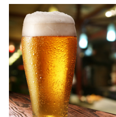
Bryggerier, tapperier, læskedrik- og frugtjuice- producenter.