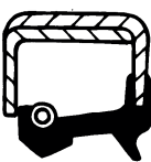
Type CS (med støvlæbe)