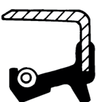
Type BS (med støvlæbe)