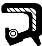
Type AS (med støvlæbe)